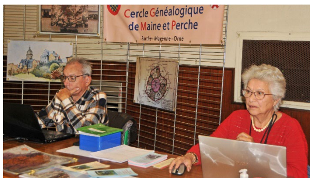
Présence du C.G.M.P. au Salon des Marmottes en Savoie